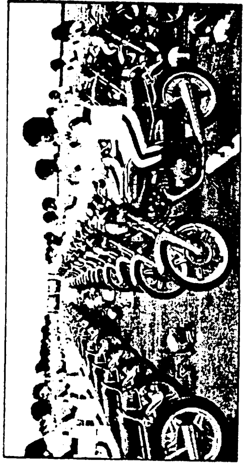
●HMS(ホンダ・モーターサイクル・リスト・スクール)の訓練風景。

楽しいモーターサイクルの世界をひろげるために—— ●乗車の基本から安全な乗り方まで、幅広い知識・技術を身につけた「安全運転普及指導員」がお待ちしています。何なりとお気軽にご相談ください。